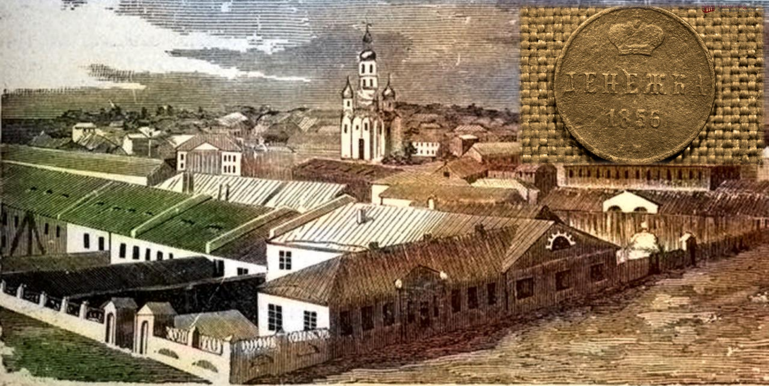
Монетный дворъ и гранильная фабрика въ Екатеринбургѣ.