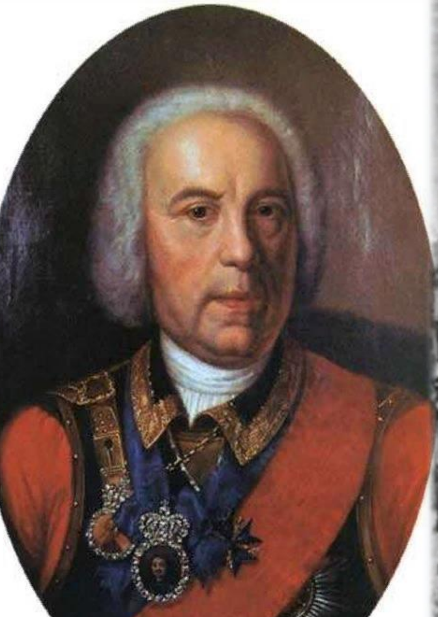
Георг Вильгельм де Геннин